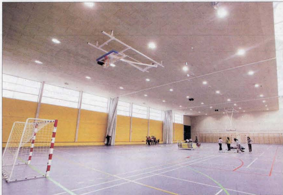
El pasado lunes, 1 de marzo, se inauguró el flamante polideportivo del IES Zorrilla.

El centro se halla inmerso en la actualidad en un Plan de Mejora de la Calidad de la Enseñanza a través de un sistema de autoevaluación.